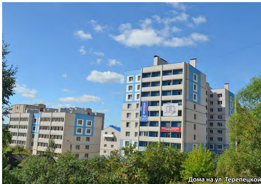
Дома на ул. Терепечкой

Николай ЛУКИЧЕВ, фото из архива организации