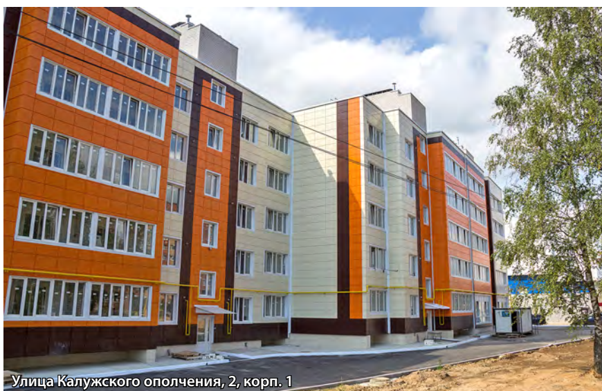
Улица Калужского ополчения, 2, корп. 1