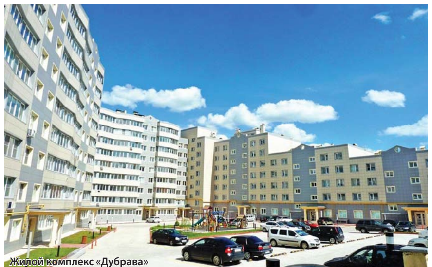
Жилой комплекс «Дубрава»

Не только жилфонд требует капремонта, не секрет, что велика