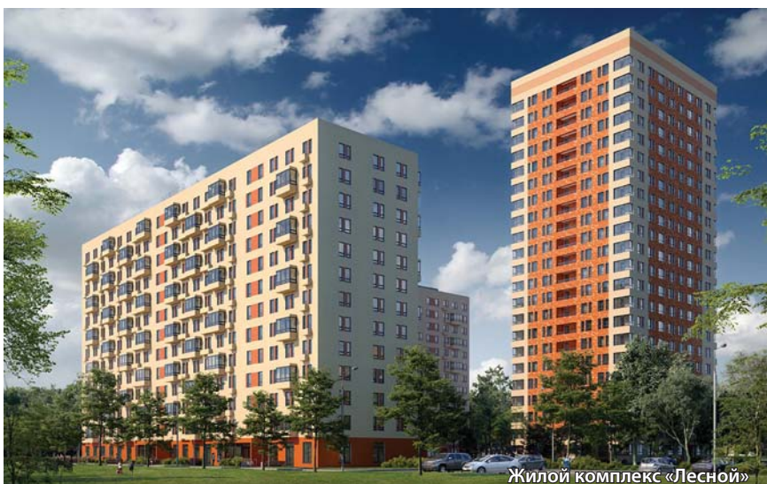
Жилой комплекс «Лесной»

— Хочу поздравить всех с наступающим праздником. Именно всех, а не только строителей, ведь от того, как хорошо сработали строители зависит качество жизни и настроение всех без исключения граждан. А работникам строительной отрасли желаю востребованности, новых интересных объектов и, конечно, здоровья, счастья, благополучия! Новых вам удач и свершений!