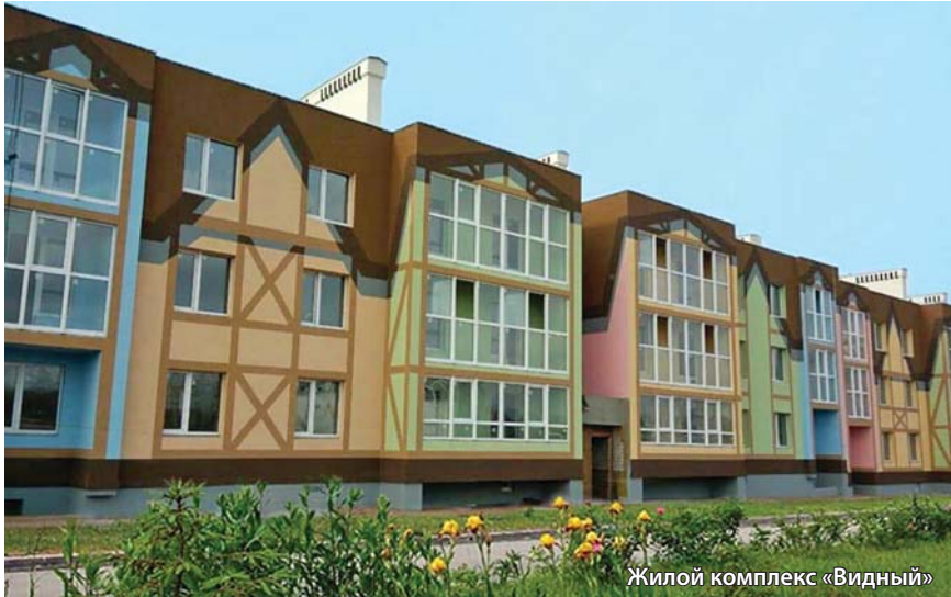
Жилой комплекс «Видный»