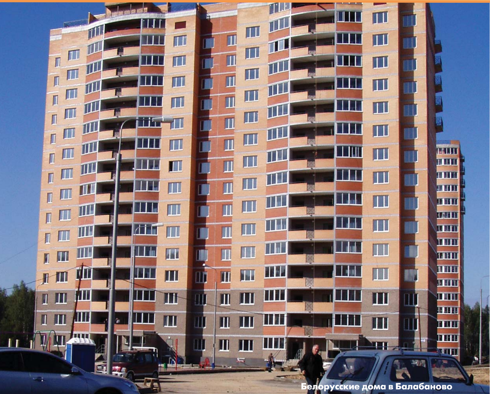
Белорусские дома в Балабаново