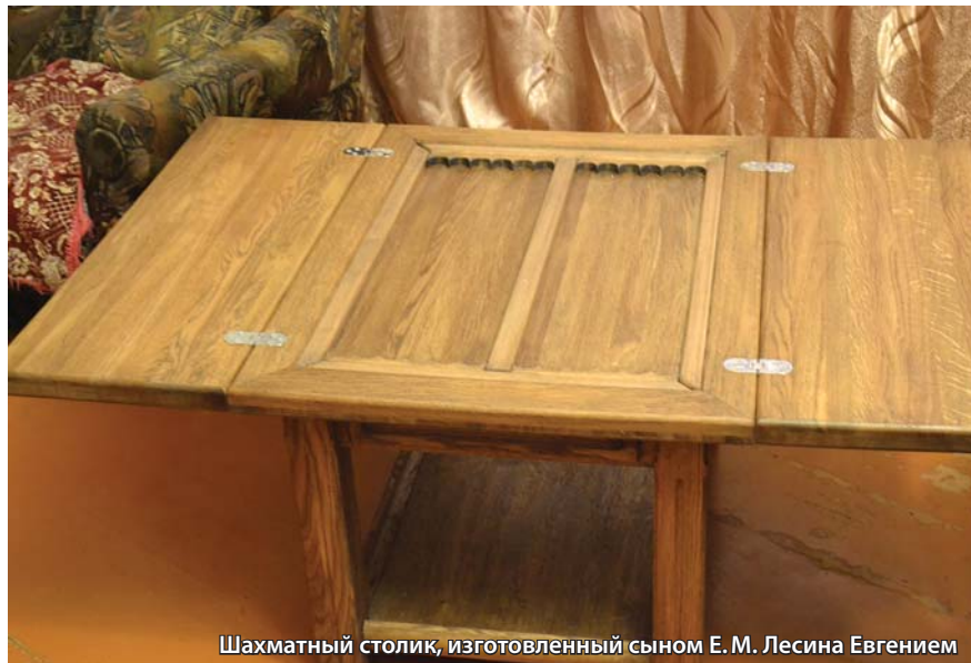
Шахматный столик, изготовленный сыном Е. М. Лесина Евгением